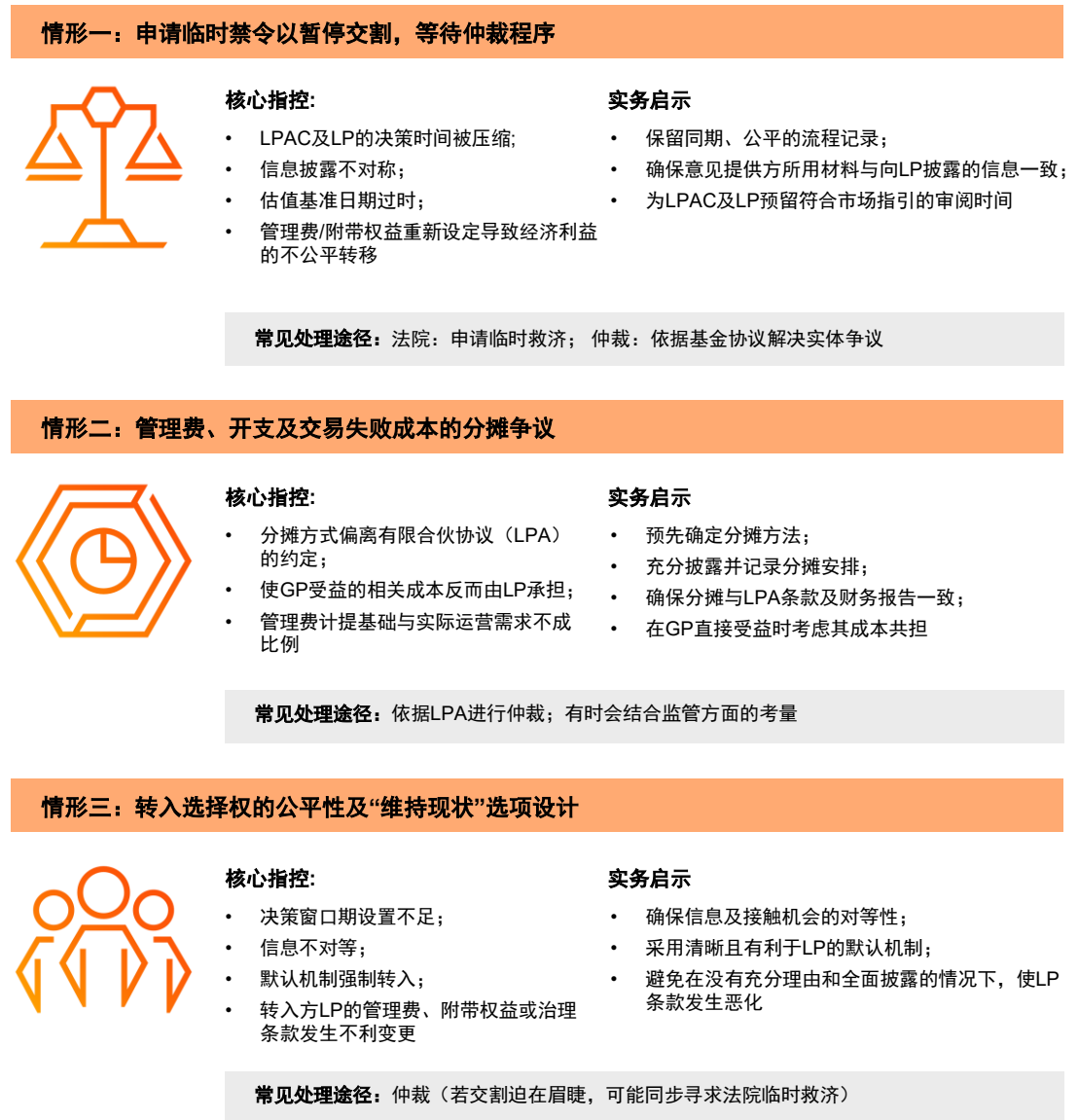
表1：接续基金常见争议情形及实务启示